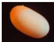
Befruchtetes Ei von Terrapene coahuila mehrere Tage nach der Eiablage