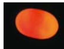
Befruchtetes Ei von Sturotypus triporcatus nach sechs Wochen Inkubationsdauer