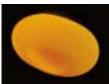
Unbefruchtetes Ei von Terrapene coahuila nach zwei Tagen nach der Eiablage. Es hat sich kein weißer Fleck gebildet