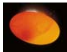
Befruchtetes Ei von Terrapene coahuila nach 3 Wochen Inkubationsdauer. Deutlich sind die Blutgefäße zu sehen