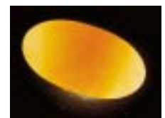
Unbefruchtetes Ei einer Schildkröte ( Claudius angustatus ) nach 4 Wochen Inkubationsdauer

Diese Bilder wurden uns freundlicherweise von Gunther Köhler zur Illustration zur Verfügung gestellt. Weitere herausragende Bilder finden Sie in seinem Buch "Die Inkubation von Reptilieneiern" - ein MUSS für jeden Reptilienfreund. Die Auszüge der Bruttablette entstammen ebenfalls diesem Buch! An dieser Stelle möchten wir uns recht herzlich für die Unterstützung von Elke Köhler, Besitzerin des Herpeton Verlags und Gunther Köhler, dem Buchautor bedanken.