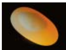
Befruchtetes Ei von Terrapene coahuila nach zwei Tagen. Der weiße Fleck ist deutlich sichtbar und breitet sich weiter aus